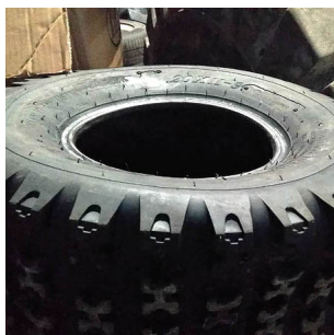
??? 3000 ?

????????? ?????????? ????? ?????? ?????????? ????????????? ?????????? ?????????? ?????????? ? ????? ????????????????? ??????????????. ??? ?????????????? ??? ????????????? ? ????? ?????????? ?????????? ??????????. ?????? ????????????? ?????????????????? ?????????????? ?????????????? ??? ?????????????????? ?????????????????? ?????? ?????????? ????? ?????????????????? ?????????????????? ?????????? ?????? ????? ?????????????????? ?????????????????? ?????????? ????????????? ????? (????????????).